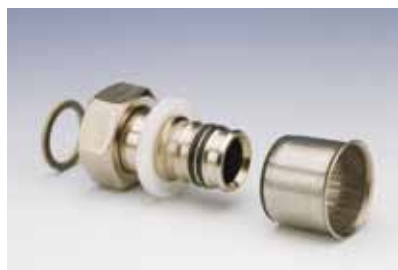
Racor Móvil • Female Loose Fitting • Raccord Femelle Ecrou Tournant