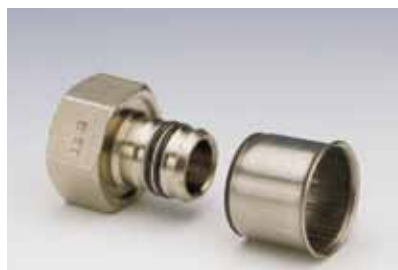
Racor Fijo Rosca Hembra • Fixed Fitting with Female Thread • Raccord Femelle Fixe