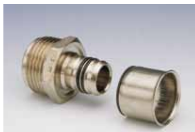
Racor Fijo Rosca Macho • Fixed Fitting with Male Thread • Raccord Mâle Fixe