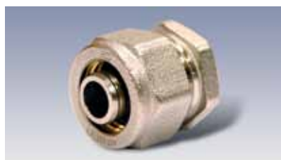
Tapón de Prueba para Calefacción • Test plug • Bouchon Essai Chauffage